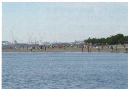
城南島海浜公園は大田区城南島の端に広がる海浜公園です。オートキャンプ場やバ

ーベキュー広場を完備。自慢の砂場では砂遊びが出来るだけでなく、車椅子で散歩が楽しめるボードウォークも設置しております。また、スケボー広場など新しい施設も充実した魅力あふれる公園です。公園からは東京港に航行する大型船舶や、羽田空港からの飛行機の離発着を間近に望む事が出来ます。